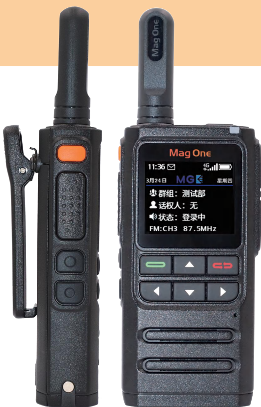
Mag One H36

通过中国通信产品进网要求认证 (China Type Approval)、SAR 辐射规范要求的测试以及国家 CQC/CCC 安全合规认证, 达到了高规格的使用安全等级。作为一家秉持企业责任感的全球企业, 摩托罗拉系统出品的 Mag One H36 除了符合中国市场的 CMMII 的环保要求外, 还满足了更为严苛的摩托罗拉系统企业内部环保要求。